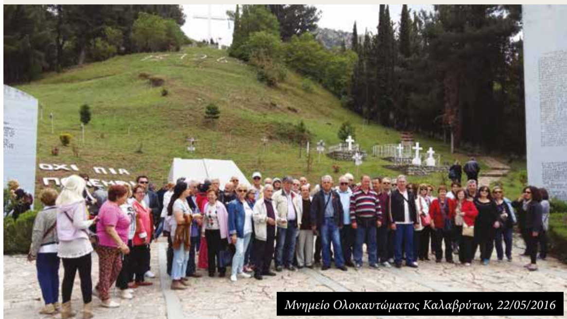
Μνημείο Ολοκαυτώματος Καλαβρύτων, 22/05/2016

Με μεγάλη επιτυχία και μαζική συμμετοχή συναδέλφων, πραγματοποιήθηκαν οι εκδρομές του Σωματίου μας το προηγούμενο διάστημα.