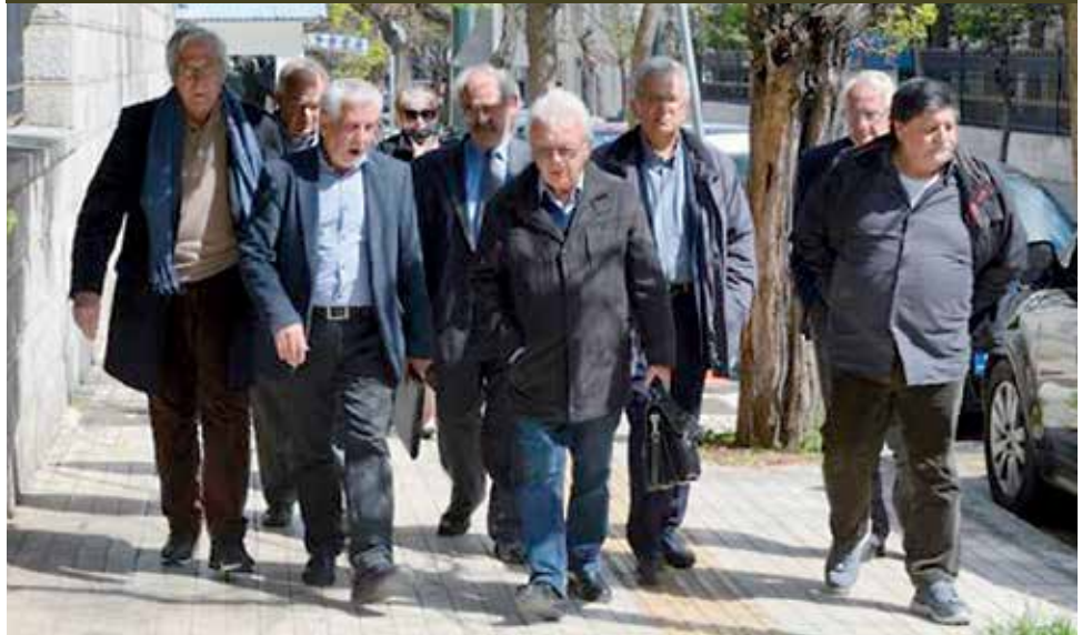
Η Αντιπροσωπεία της ΣΕΑ κατά την προσέλευση της στο Μέγαρο Μαξίμου

Δελτίο Τύπου των Συνεργαζόμενων Συνταξιοχικών Οργανώσεων ΙΚΑ - ΟΑΕΕ - ΔΗΜΟΣΙΟΥ - ΠΟΣΕ ΟΑΕΕ - ΕΛΤΑ - ΟΣΕ - ΠΕΣ-ΝΑΤ - Π.Σ.Σ. ΔΙΚΗΓΟΡΩΝ - ΠΕΤΟΜ-ΤΕΕ