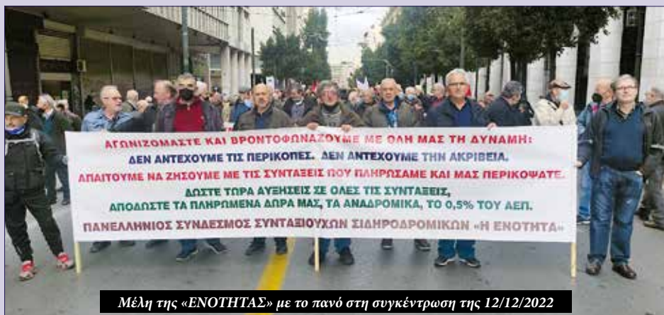
Μέλη της «ΕΝΟΤΗΤΑΣ» με το πανό στη συγκέντρωση της 12/12/2022