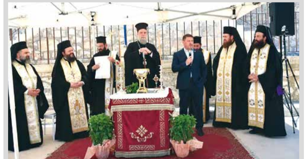
Στο κέντρο ο Μητροπολίτης Γαβριήλ με τον Περιφερειάρχη Αττικής Ν. Χαρδαλιά

Η Μητρόπολη της Νέας Ιωνίας εγκαινίασε τις κατασκηνώσεις της Σφενδάλης των Σιδηροδρομικών που ανήκανε στο Ταμείο Αλληλοβοήθειας του προσωπικού ΟΣΕ