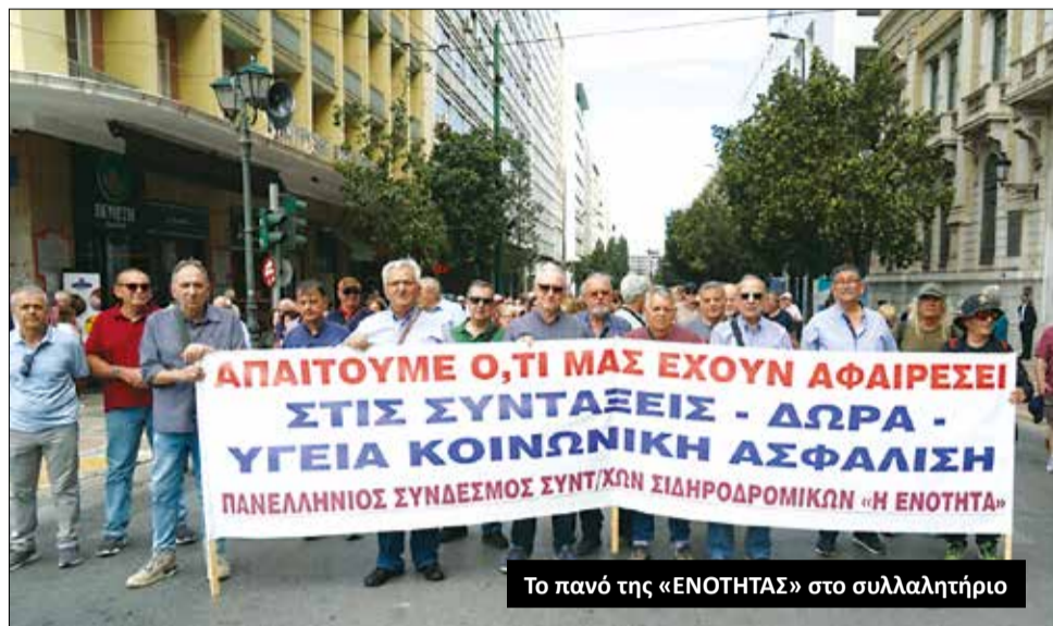
Το πανό της «ΕΝΟΤΗΤΑΣ» στο συλλαλητήριο